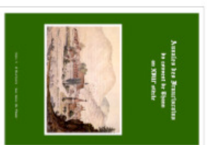
Tome I (1701-1742)

Cet ouvrage de plus de 500 pages comprend en outre un index des noms propres et un index des noms de lieux ainsi que nombre d'illustrations.